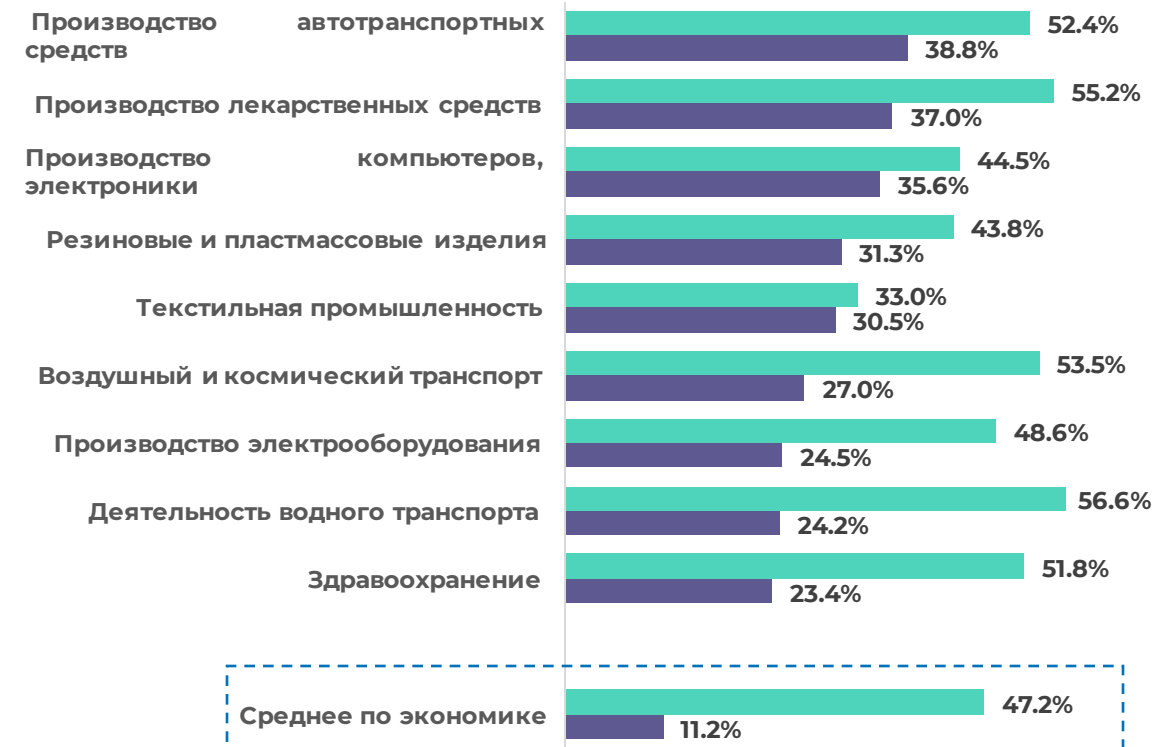
Отрасли, наиболее зависимые от импорта В порядке убывания общей доли

■ Доля импорта в потреблении по категории "машины и оборудование"