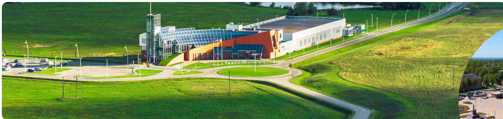
Гусев (Калининградская обл.) — GS Group Научно-производственный кластер «Технополис GS», построенный с нуля