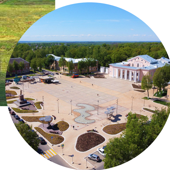
Щекино (Тульская обл.) — «Щекиноазот» Советский город 2.0, гармоничное развитие социальной сферы промышленного города